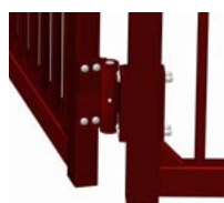
Bearbeitetes Scharnier, belastbar bis 400 kg