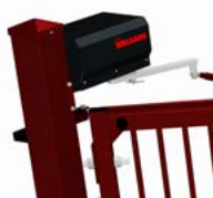
Schneckengetriebemotor mit Zahnkranz.