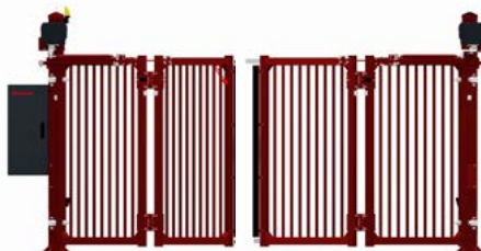
Feuerverzinkt – Doppelflügel