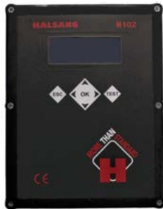
Schaltkasten mit einer Halsang H102 Steuerung und Frequenzmodulatoren