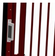
Elektromagnetische Ver- riegelung.